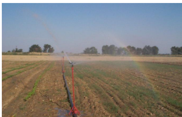
Рис. 2. Пробный запуск стационарной системы перед посевом