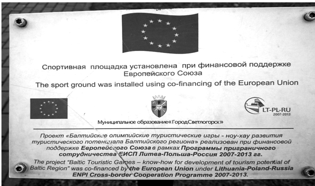
Figure 4 Sports ground construction supported by the European Union, Svetlogorsk